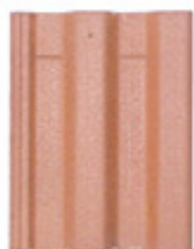
Terracota Natural Tonalizada