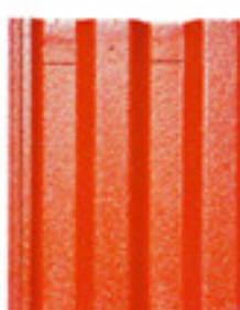
Terracota Color Intenso