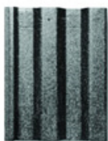
Negro Color Intenso